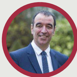
Eric Bothorel Député